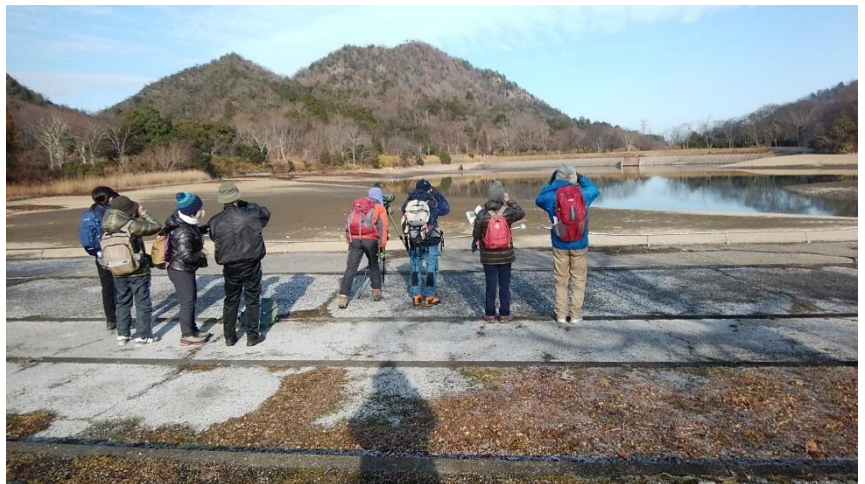
<山上ダムで水鳥を観察中>