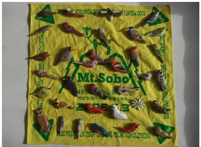
<自作の鳥のプローチです。イカル、ライチョウ、ウソもいます。>